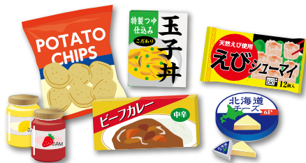
◆期限設定のイメージ図

弊社では、客観的な期限設定のために保存試験(微生物検査・理化学検査)を受託しております。期限設定の科学的根拠として、ぜひご利用ください。